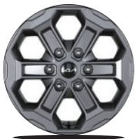
17인치 알로이 휠