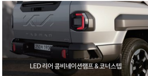
LED 리어 콤비네이션램프 & 코너스텝