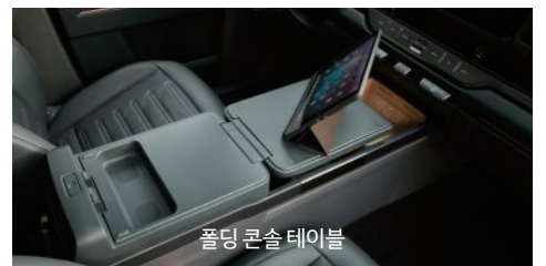
폴딩 콘솔 테이블

※ 상기 사양 구성은 차급 및 선택 사양에 따라 다르게 적용됩니다. 본 인쇄물에 수록된 제품 색상 및 이미지는 실제와 다를 수 있습니다.