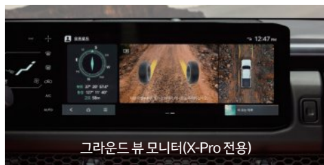
그라운드 뷰 모니터(X-Pro 전용)