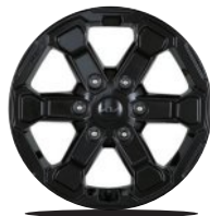
17인치 블랙 알로이 휠(X-Pro 전용)