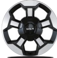
18인치 전면가공 휠