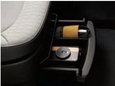
副驾驶席座椅下储物盒