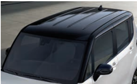
黑色车顶、黑色A柱、黑色外后视镜、 黑色鲨鱼鳍天线

以上规格配置会根据动力总成、车型及选装配置而有所不同。 ※ 黑色车顶与黑色A柱为贴膜型。