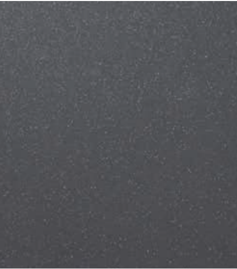
星云灰 (M7G) *