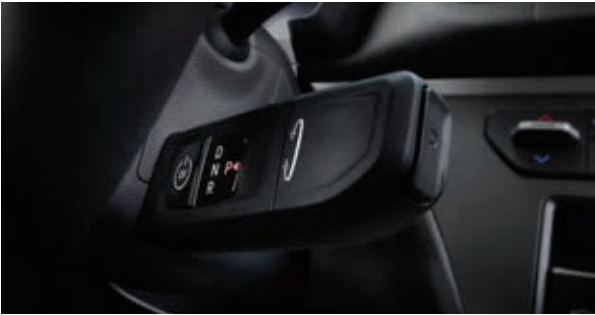
柱型电子式换挡杆