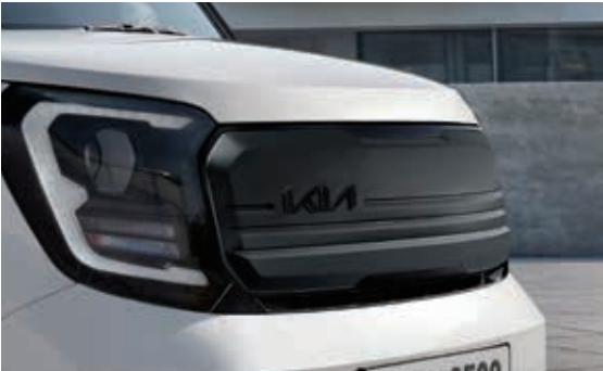
暗金属色中网饰件、黑色车标