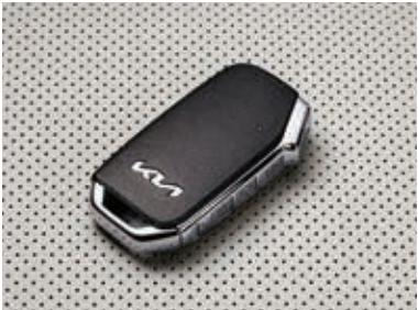
智能钥匙(含遥控启动)