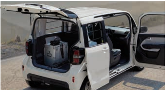
1.0汽油_洁净白(UD) / 以上规格配置会根据动力总成、车型及选装配置而有所不同。