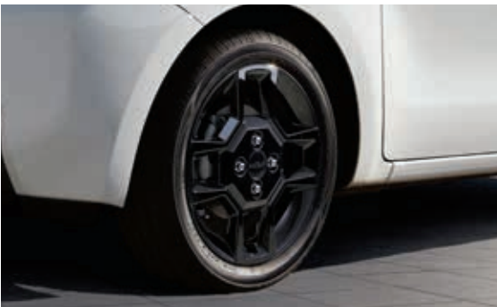
15英寸X-Line专用黑色合金轮毂