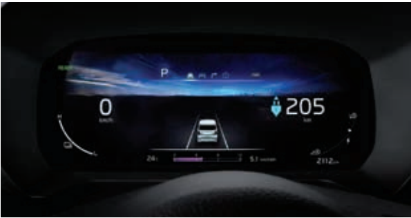
超视觉仪表盘(10.25英寸炫彩TFT LCD)