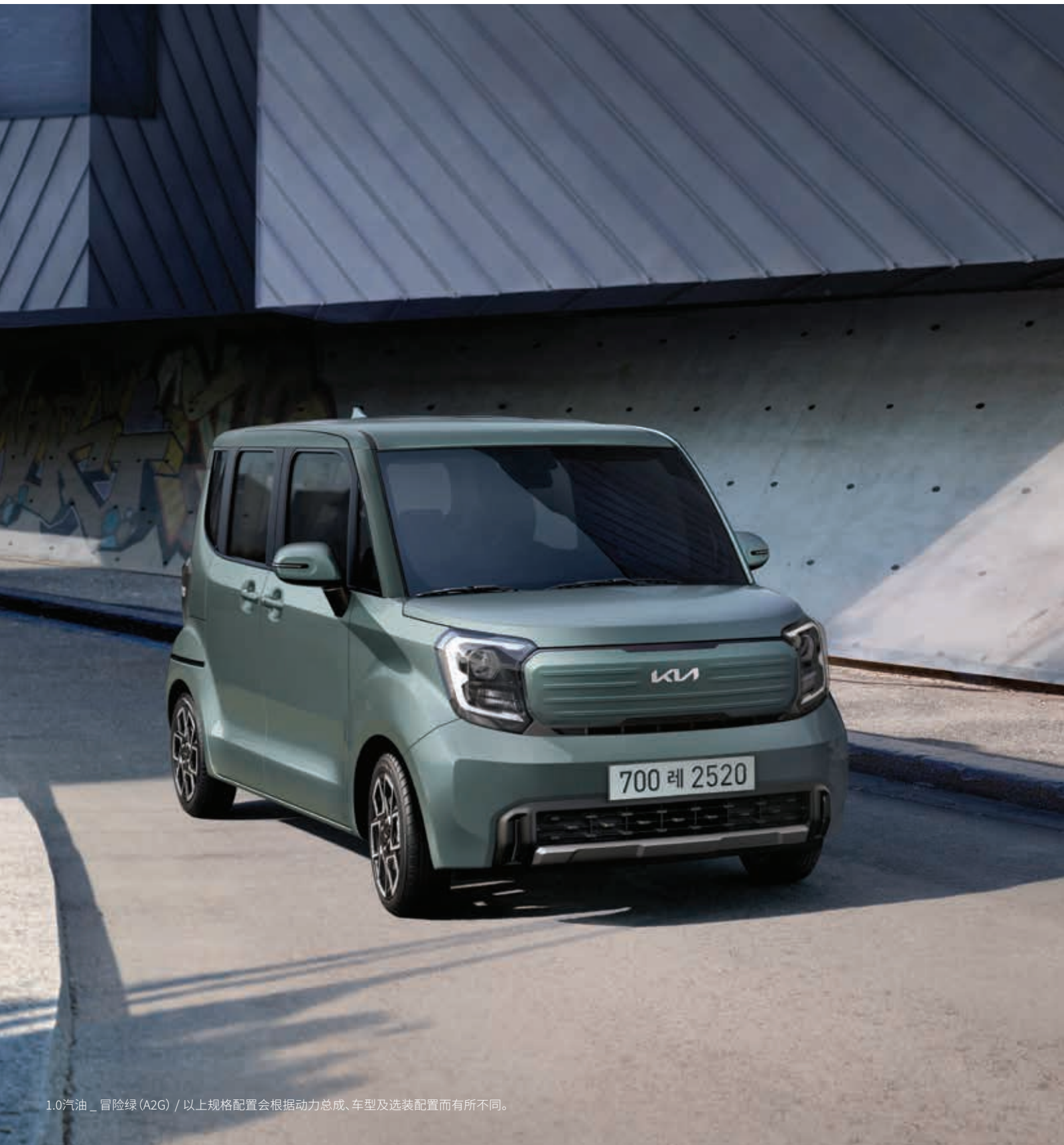
1.0汽油 _ 冒险绿 (A2G) / 以上规格配置会根据动力总成、车型及选装配置而有所不同。