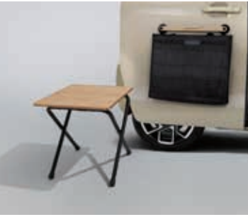
露营桌&侧面可拆卸式收纳包套装