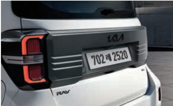
暗金属色尾门饰件、黑色车标