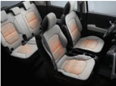
前排/后排加热座椅*