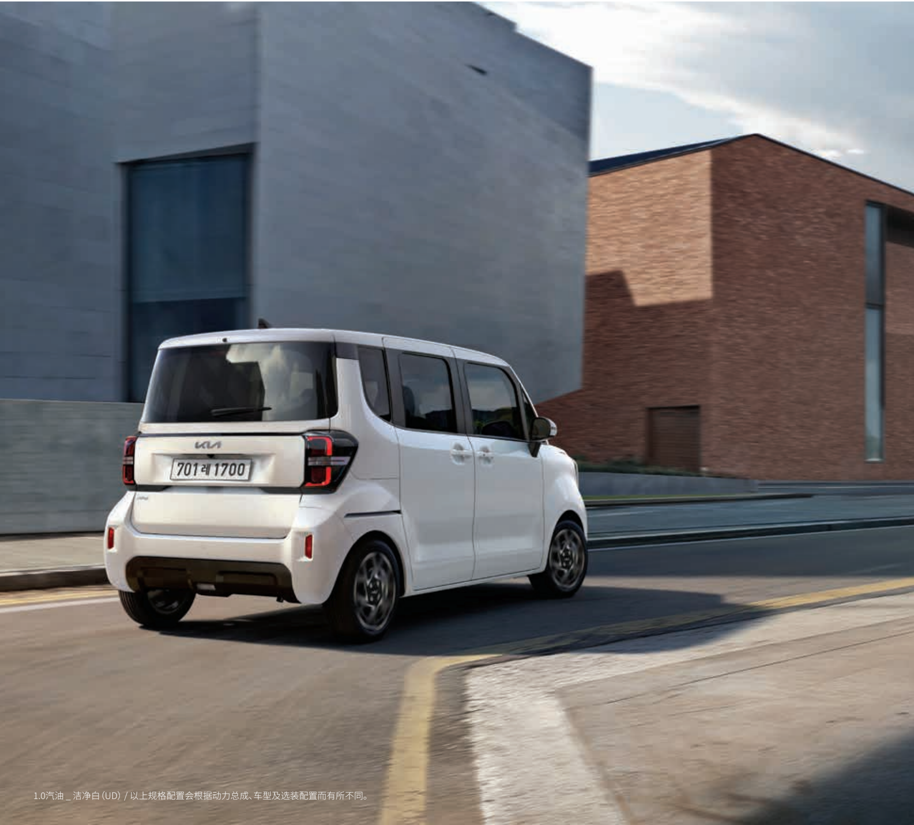
1.0汽油 _ 洁净白 (UD) / 以上规格配置会根据动力总成、车型及选装配置而有所不同。