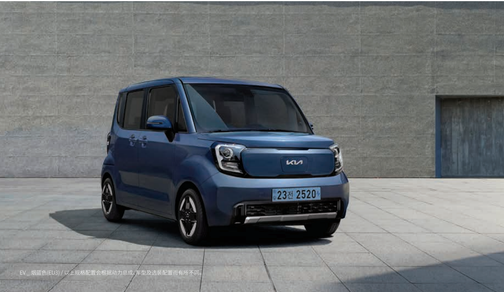
EV _ 烟蓝色(EU3) / 以上规格配置会根据动力总成、车型及选装配置而有所不同。

日常更从容, 商务更智能 驾驶The Kia Ray EV, 尽享多彩的日常移动出行生活!