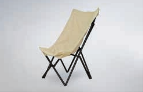
蝴蝶椅 (Minimal works)