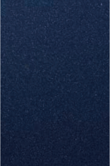
烟蓝色 (EU3) *