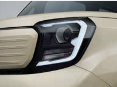
投射式前大灯、LED日间行车灯