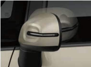
外后视镜(锁车自动折叠)*