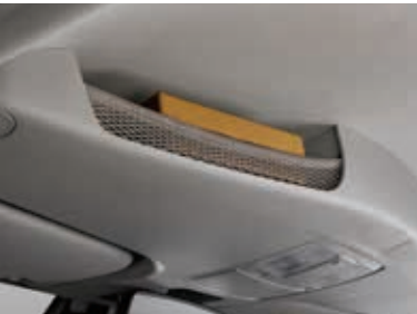
大容量车顶控制台