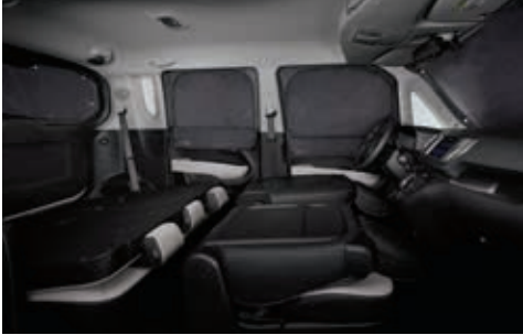
多功能遮阳帘(前窗/侧窗/后窗)