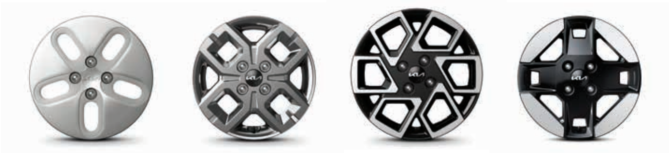
14英寸钢制轮毂 (全尺寸轮毂盖)