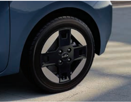
14英寸合金轮毂(EV专用)