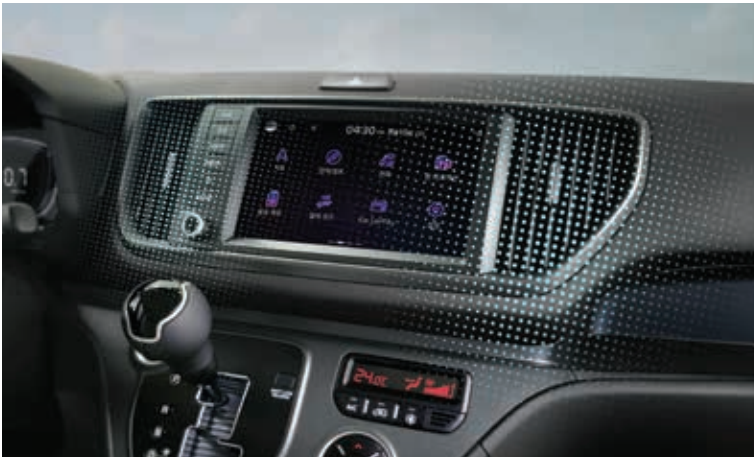
空气净化模式* 阻隔空气染污物进入车内, 有效净化车内空气, 打造舒适的车内环境。