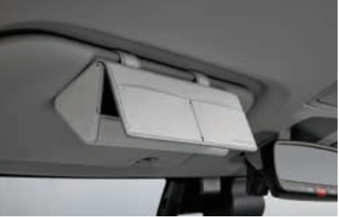
遮阳板车载眼镜盒