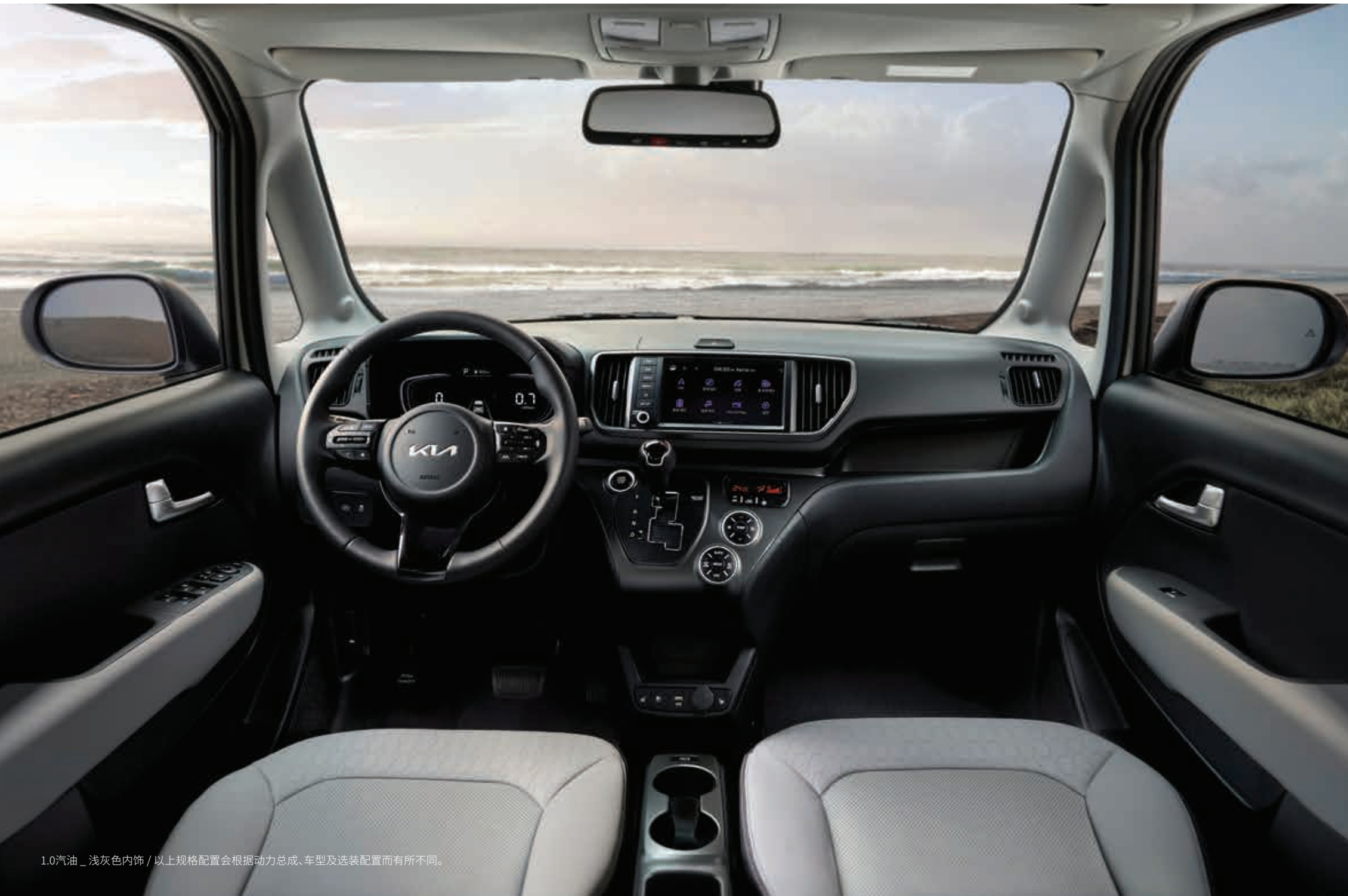
1.0汽油_浅灰色内饰/以上规格配置会根据动力总成、车型及选装配置而有所不同。