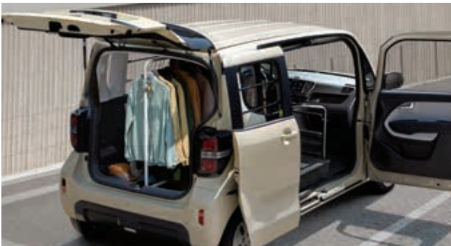
1.0汽油_奶米色(M9Y) / 以上规格配置会根据动力总成、车型及选装配置而有所不同。