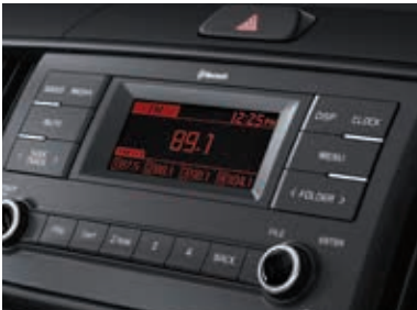
紧凑型音频播放器