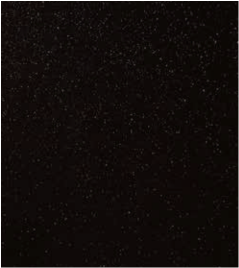
极光黑 (ABP) *