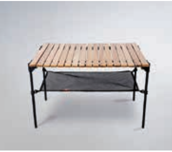
蛋卷桌 (Minimal works)