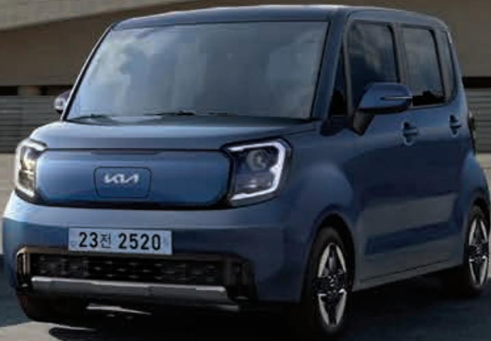
EV _ 烟蓝色(EU3)