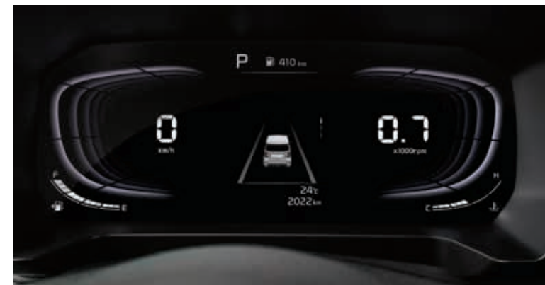
超视觉仪表盘(4.2英寸炫彩TFT LCD)