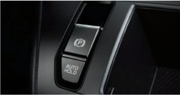
电子驻车制动(含自动驻车)