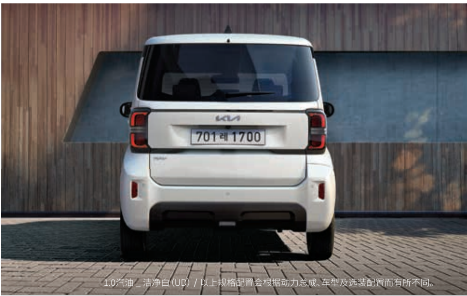
1.0汽油 _ 洁净白 (UD) / 以上规格配置会根据动力总成、车型及选装配置而有所不同。