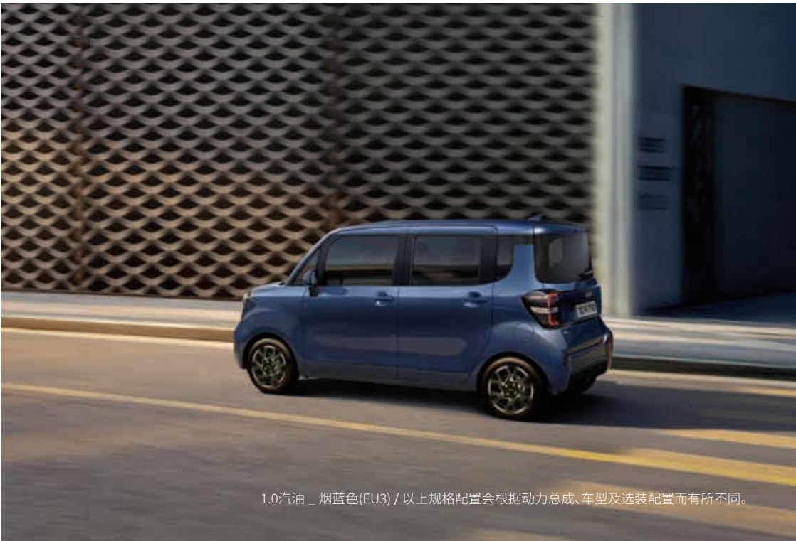
1.0汽油 _ 烟蓝色 (EU3) / 以上规格配置会根据动力总成、车型及选装配置而有所不同。