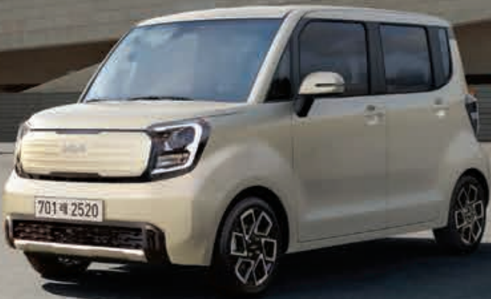
1.0汽油 _ 奶米色(M9Y)