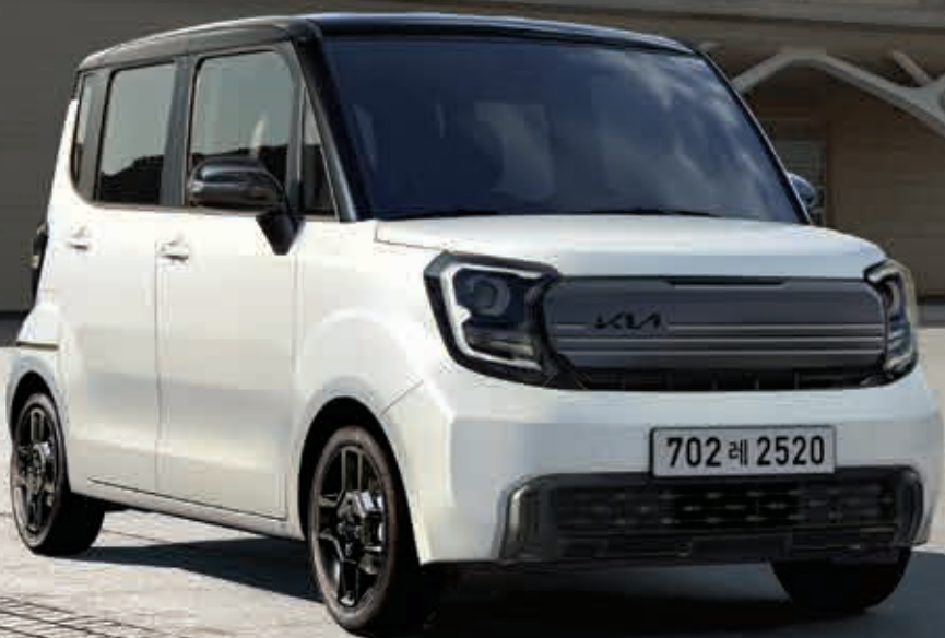
1.0汽油X-Line _ 洁净白 (UD)