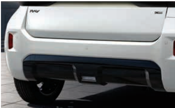
后车底护板、X-Line专属车标