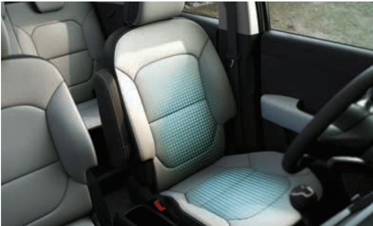
驾驶席通风座椅* 座椅内置通风风扇可以产生风, 为用户营造舒适的驾驶环境。