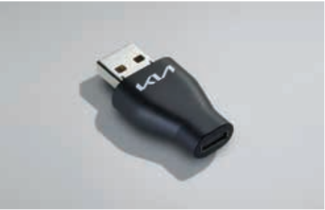
C to USB-A转接头