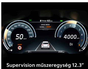
Supervision műszeregység 12.3"