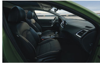
Választható szintetikus bőr/textil kárpitozás X-GOLD és X-PLATINUM felszereltséghez (CPB fehér varrással) Választható szintetikus bőr/textil kárpitozás X-GOLD és X-PLATINUM felszereltséghez (CPK kék varrással)