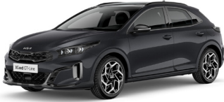
Penta Metal (H8G)