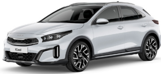
Cassa White (WD)