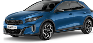
Blue Flame (B3L)