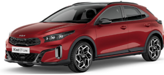
Infra Red (AA9)