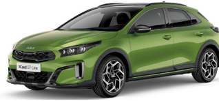
Celadon Spirit Green (CE6)