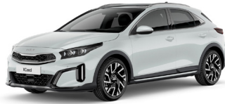
Deluxe White (HW2)