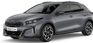
Lunar Silver (CSS)