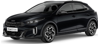
Black Pearl (1K)