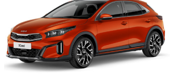
Orange Fusion (RNG) GT-Linehoz nem elérhető