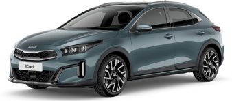
Yuca Steel Gray (USG) GT-Linehoz nem elérhető